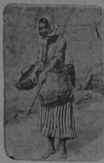
Otra transformación de la Mistinguet, recorriendo la playa con los pies descalzos. Ella encuentra ese ejercicio muy saludable y muestra á los campesinos bretones los pies más lindos que han visto ojos humanos.