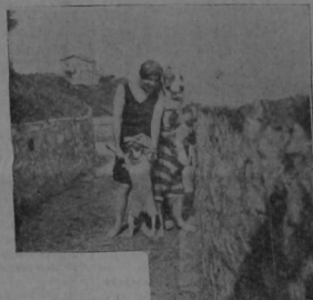
Mlle. Spinnely se divierte en los balnearios con sus perros que son los mejores amigos que tiene. Eso dice ella.