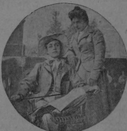
Lina Cavalleri también se viste de hombre y fuma y se toma un cocktail de whiskey con la mayor seriedad

Un cambio completo de aire, de trajes y de costumbres, devuelve á las artistas parisienses, la salud que en las temporadas teatrales derrochan