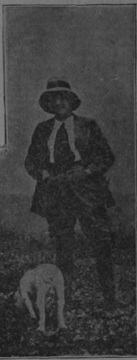
Yvonne de Vray en cuanto deja París, se viste de hombre y se dedica á la cacería. Vuelve con la piel tostada, pero llena de salud y de alegría.

Luis XV, deben seguir el ejemplo de estas reinas de la moda