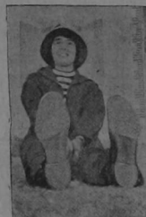
Mistinguet es la más loca de todas. Vestida de marinero, corre por las costas de Bretaña y dá á los fotógrafos oportunidad de retratarla en las más divertidas posturas.