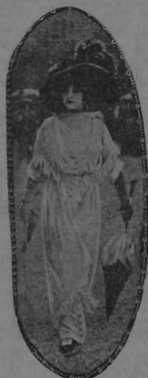
En cambio otras se van á las playas de moda y allí siguen vistiendo sus lujosos trajes y tirando el oro á potulados.