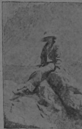
Ala Spinnely le gusta también ir á Suiza á buscar las «posticiones elevadas.»